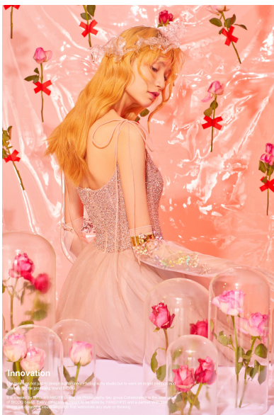
HAIR: YANSHI | MAKEUP: KASUMI | STYLING: HILAN | GROOM: TIBBU MITAR